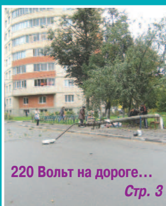
220 Вольт на дороге... Стр. 3

Администрация и Совет депутатов городского поселения Красково