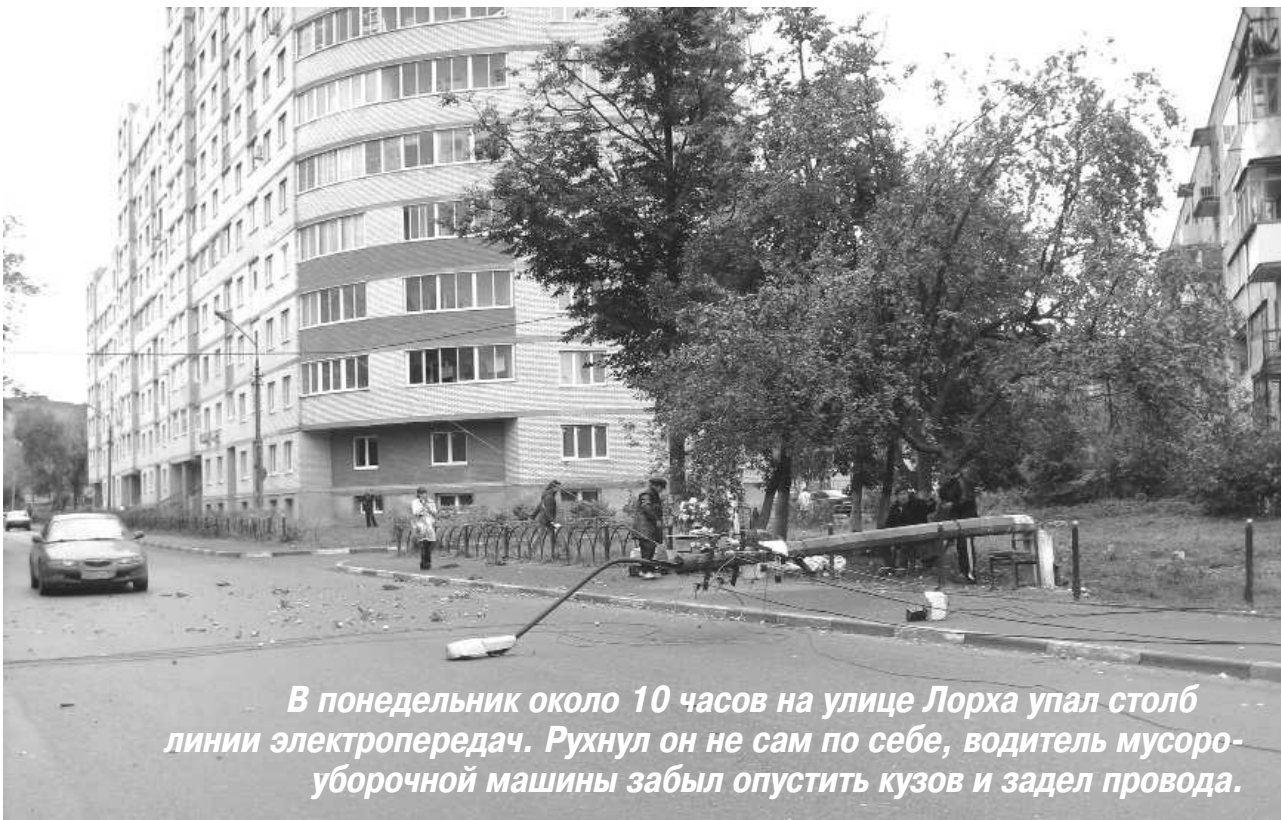
В понедельник около 10 часов на улице Лорха упал столб линии электропередач. Рухнул он не сам по себе, водитель мусороуборочной машины забыл опустить кузов и задел провода.